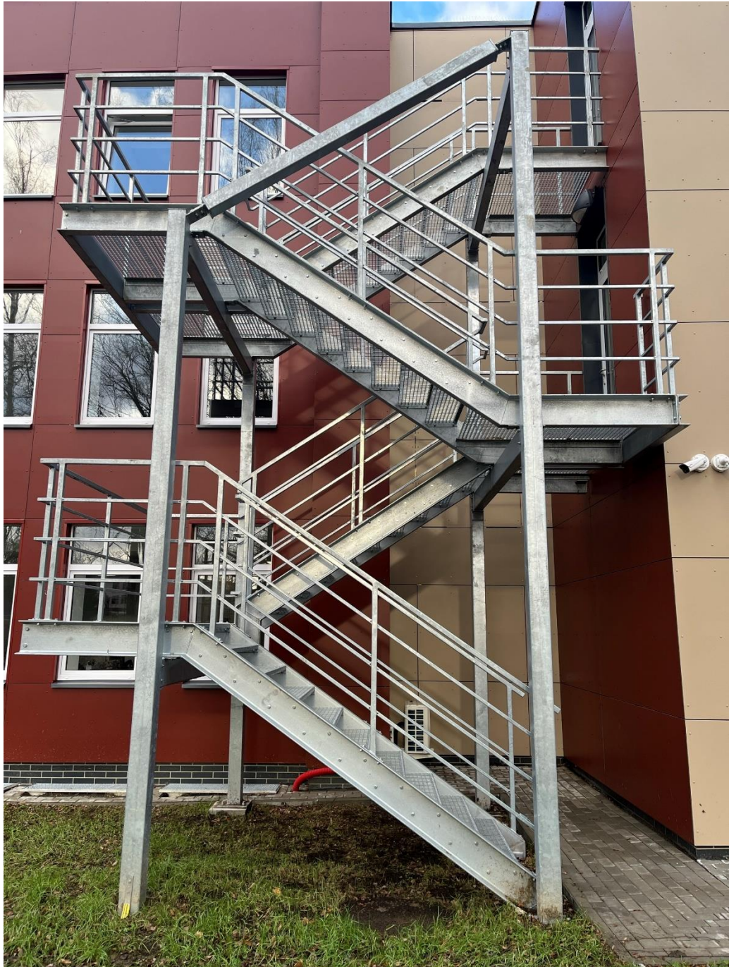
Lauko laiptinės įrengimo pavyzdys.